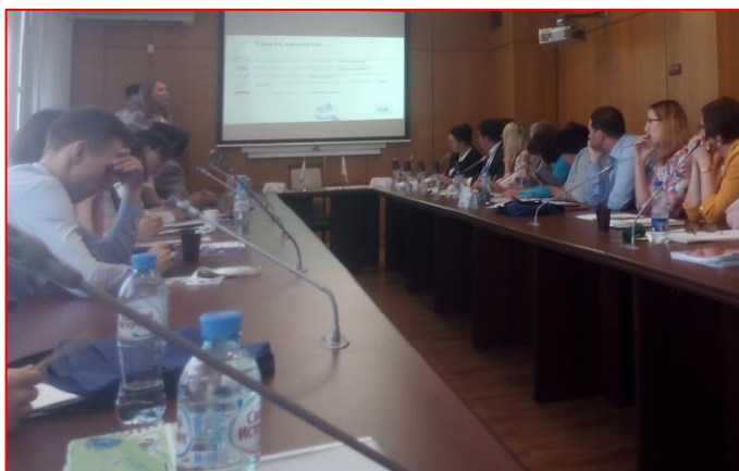
Участники номинации «Моя педагогическая инициатива»