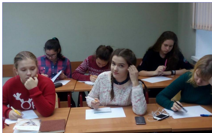
Творческая мастерская «Экономический ребус»

Во второй день состоялась творческая мастерская «Экономический ребус», в ходе которой ребята получили информацию об исторической родине ребусов, их трансформации, занимались разгадыванием экономических ребусов, определением содержания отгаданных понятий. Участники попробовали создать собственные ребусы по изучаемому профилю.