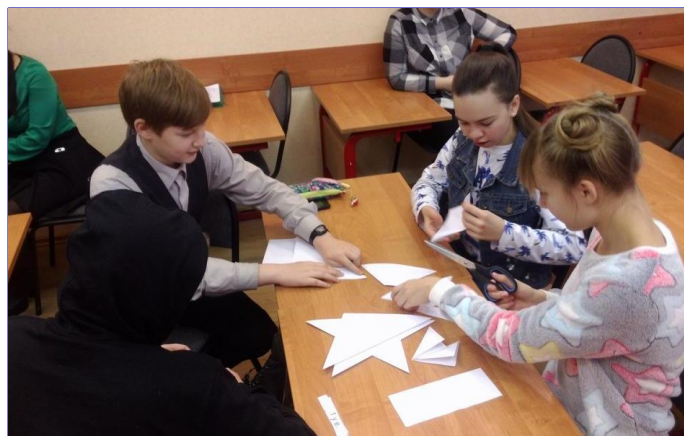
7 класс за выполнением творческого задания