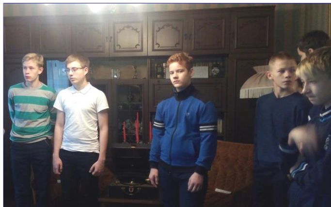
В гостиной у В.И. Белова

Обучающиеся обратили внимание на большое количество книг в домашней библиотеке Василия Ивановича (она насчитывает более четырех тысяч томов). Писатель интересовался историей и философией, постоянно читал и занимался самообразованием.