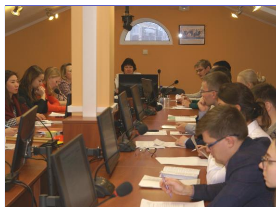
Заседание секции «Социально-экономическое развитие и управление территориальными системами и комплексами»