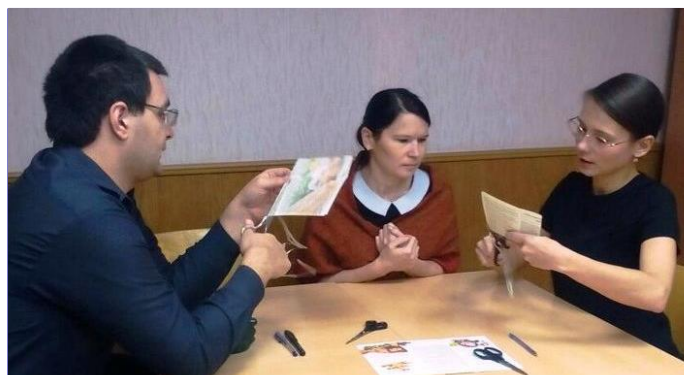
Аспиранты в работе над творческим заданием

По мнению участников, подобные мероприятия способствуют более успешной и быстрой адаптации к новым условиям труда и обучения, что в свою очередь положительно отражается на результатах профессиональной и учебной деятельности.