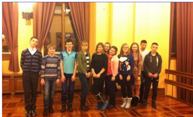
Обучающиеся во время антракта

Школьники отметили, что эта интересная и трогательная постановка очень их впечатлила.