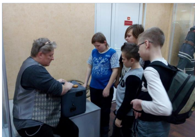
Экскурсовод показывает устройство противогаса

В завершение экскурсии обучающиеся поблагодарили экскурсовода за мероприятие и задали интересующие их вопросы.