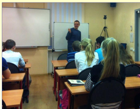
Тренинг «История успеха, ошибки предпринимателя на личном опыте»

Данные мероприятия направлены на расширение знаний школьников, развитие их познавательной активности и формирование предпринимательской мотивации.