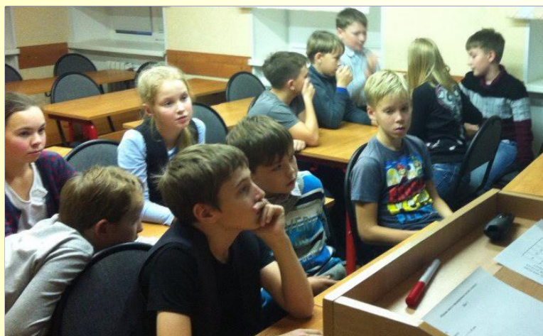
Деловая игра «Первые шаги предпринимателя»